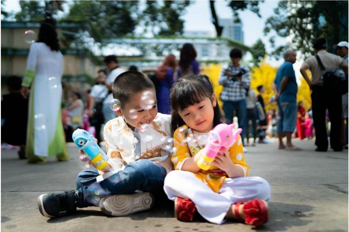
Mấy sắp nhỏ hồn nhiên trước khoảng sân nắng. Bóng xà bông khiến chúng mê mẩn chẳng màng đến người lớn xung quanh.