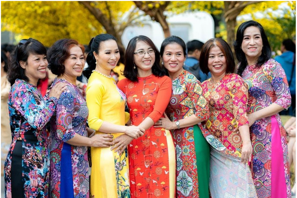
Người từng trải gác lại mọi ưu tư, cùng nhóm bạn vui xuân rạng ngời.