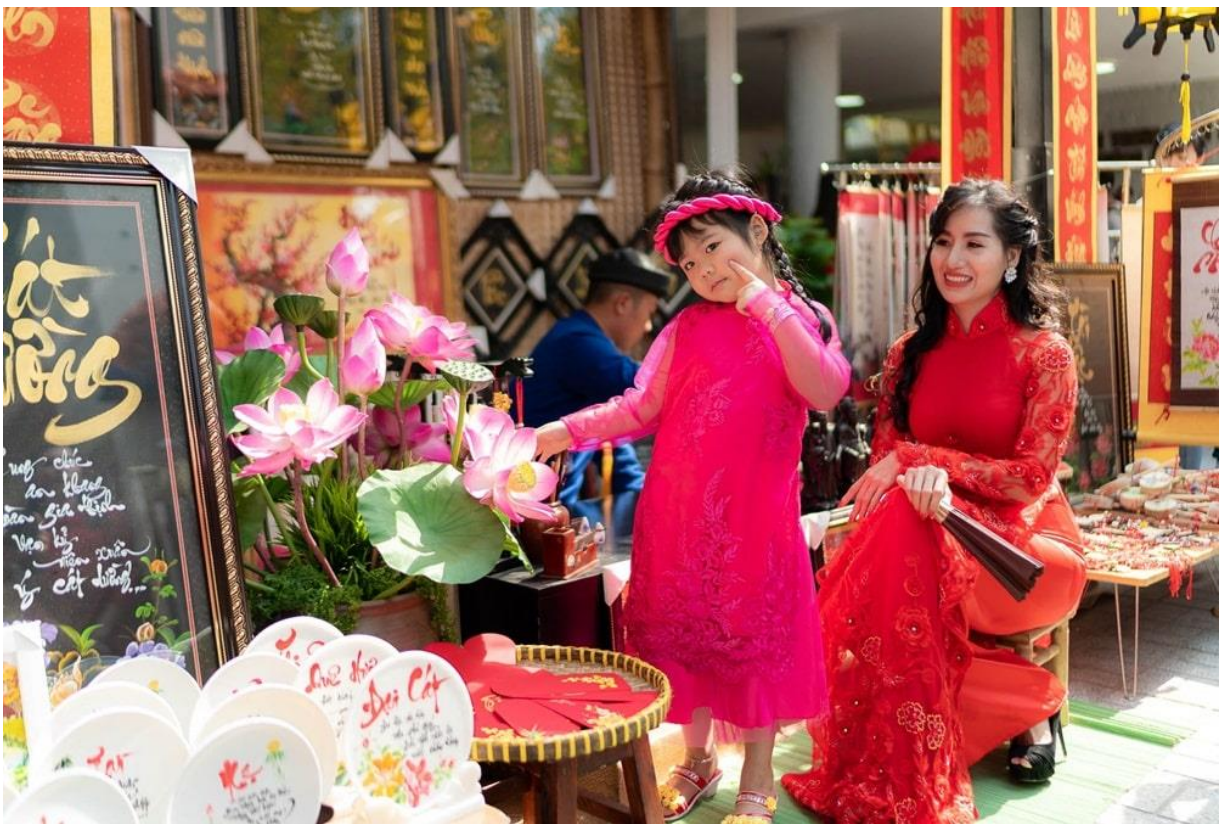
Giữa gian ông Đồ, có cô bé làm điệu bên bông sen.