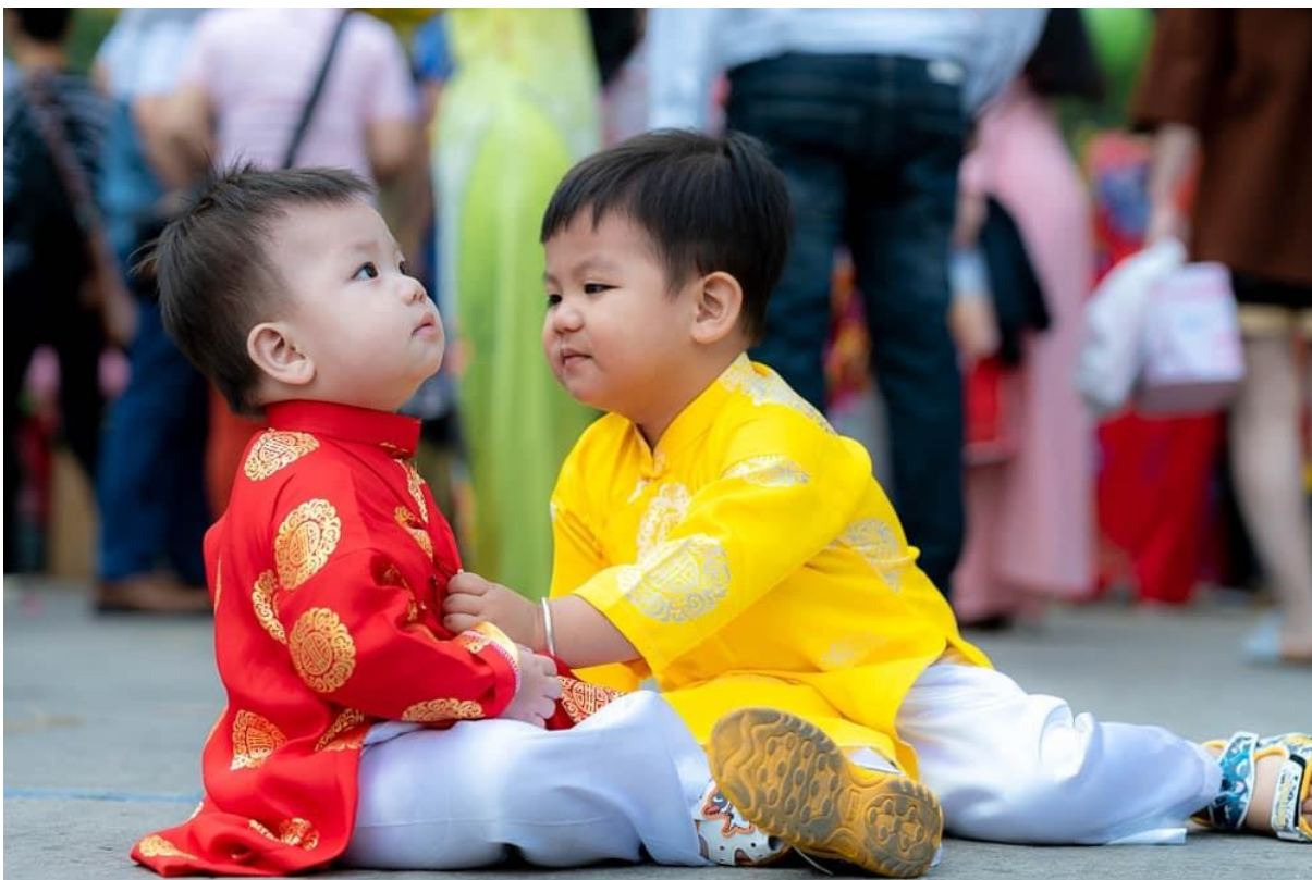
Anh em xúng xính ngày xuân.