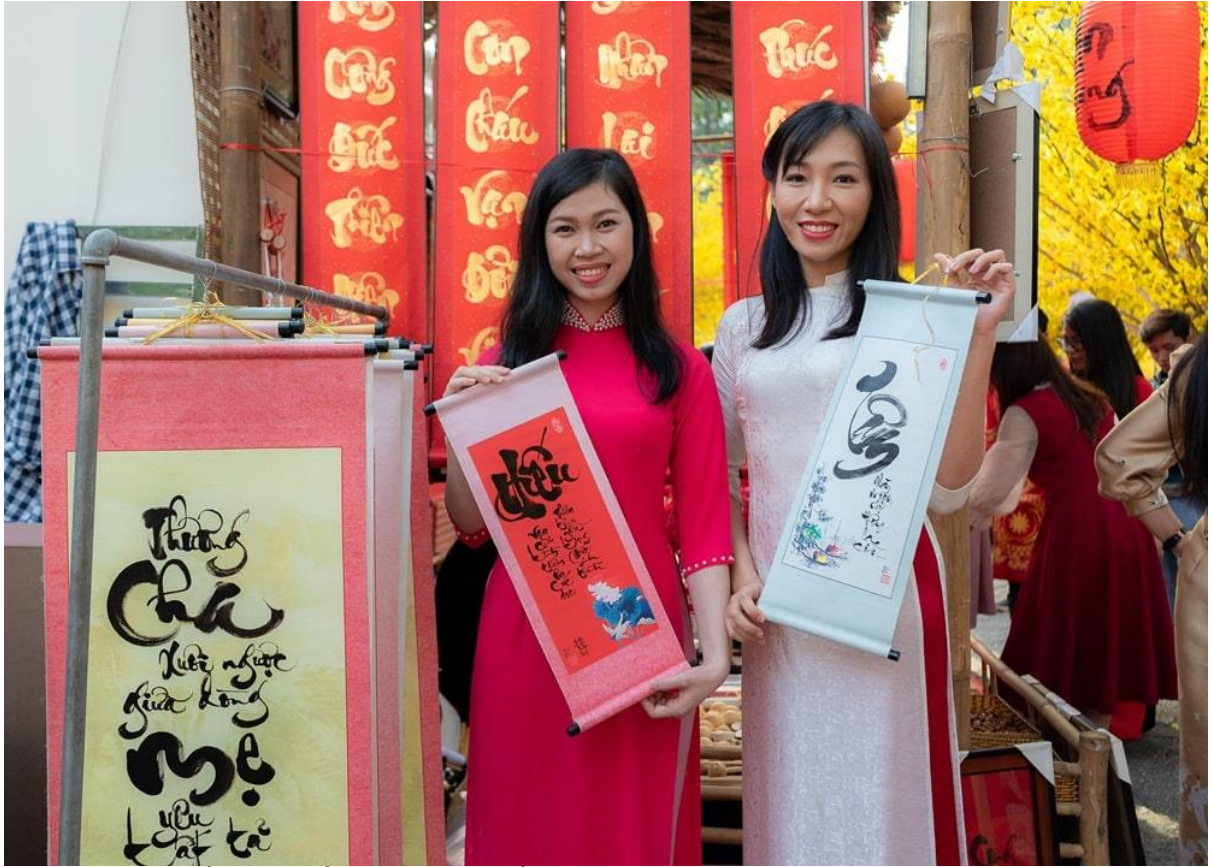
Người trẻ tìm về cội nguồn, nhớ chữ Hiếu, chữ Tâm...