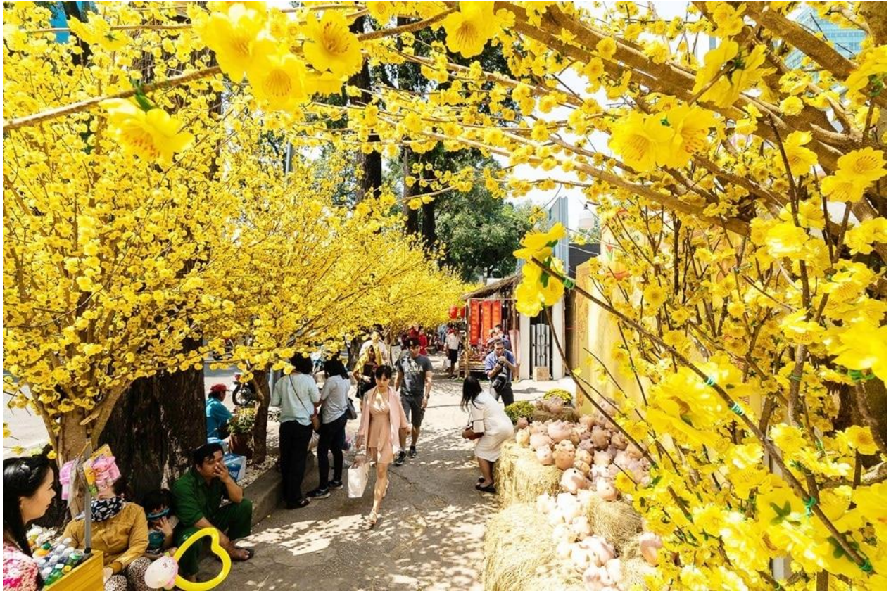
Có người ví sắc hoa như xứ người. Có lẽ điều đó chẳng hề sai.