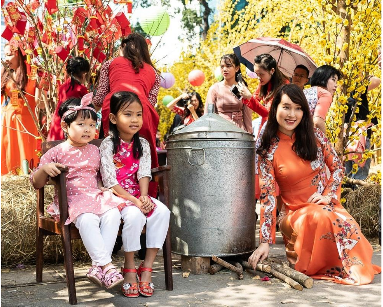
Dầu giã dị bao nhiêu, nồi bánh tét lại là lần đầu tiên đám nhỏ được trông thấy.