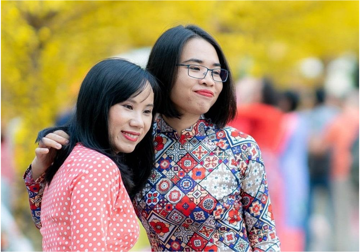
Nơi mỗi người đều trở nên cười mở, tươi vui trong không khí xuân đang về.