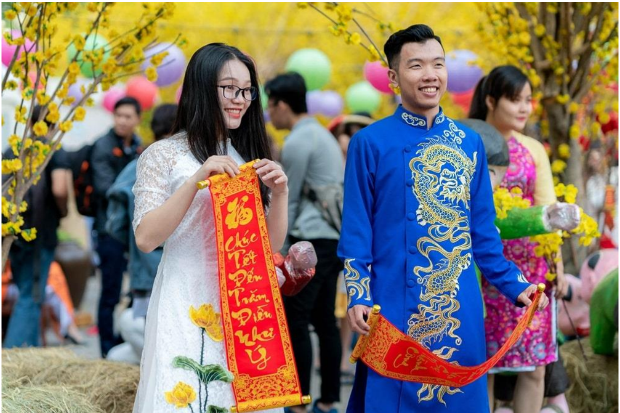
Những nụ cười rạng rỡ.