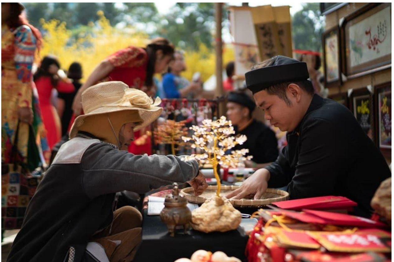
Người Sài Gòn vốn giản dị, gần gũi, chẳng câu nệ tiêu tiết... Chẳng phân sang hèn, cao thấp, ông Đồ và cụ bà với vẻ ngoài tênh toàng vẫn trò chuyện cởi mở, thân tình. Hình ảnh sáng lấp lánh như cây sống đời.