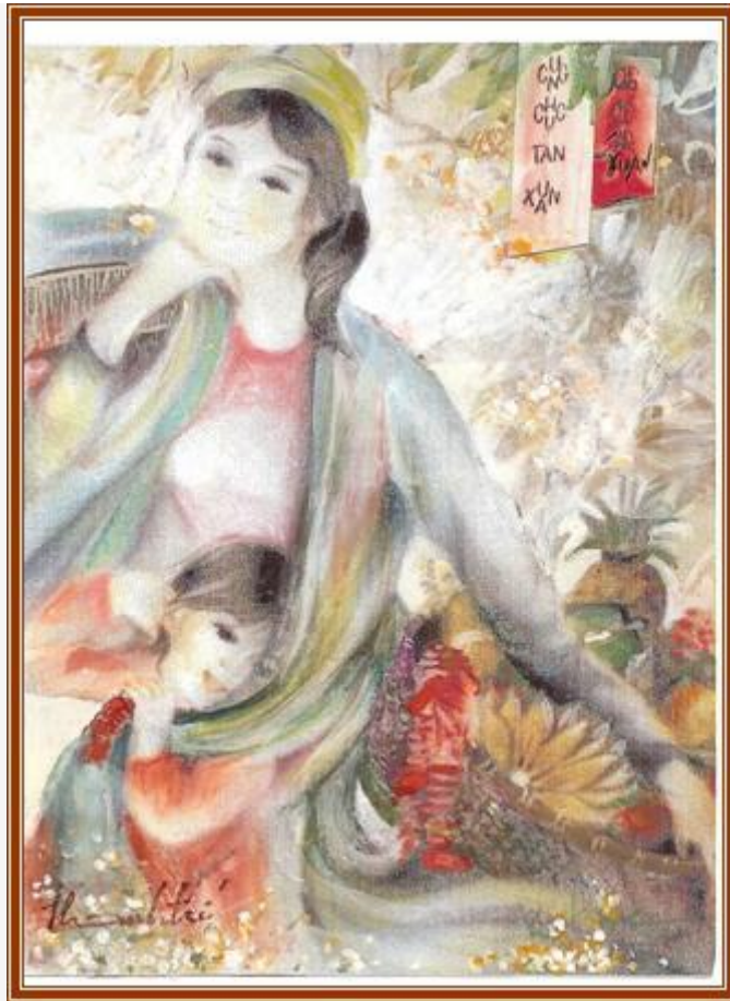
Theo mẹ đi chợ Tết - Artist Thanh Trí