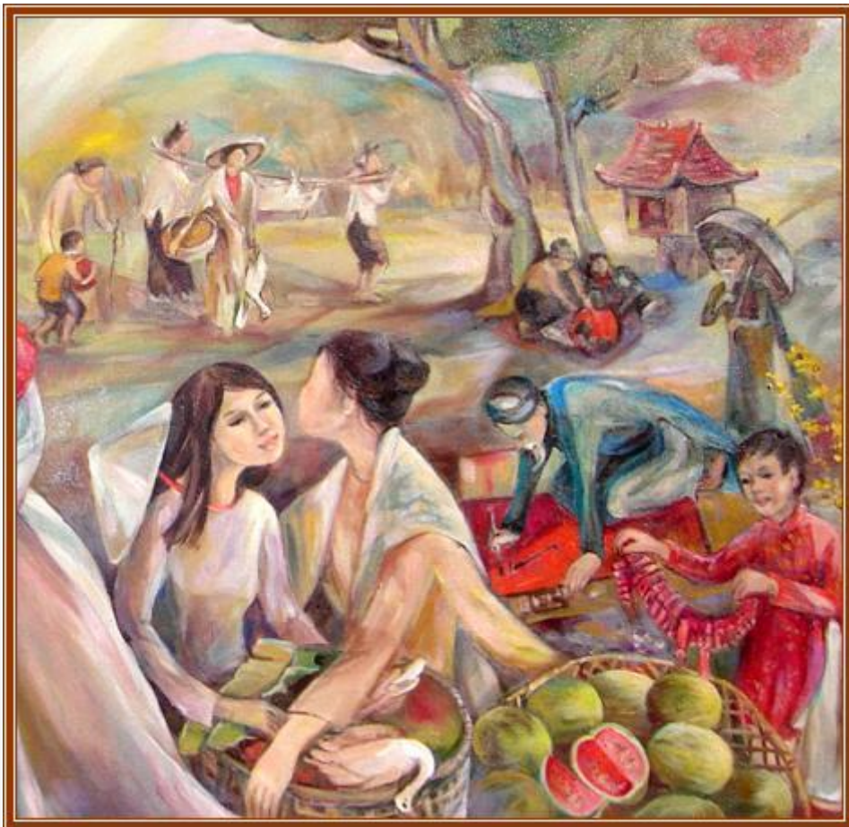
Chợ Tết (hai cô Nam Kỳ bán dưa hấu) - Artist Thanh Trí