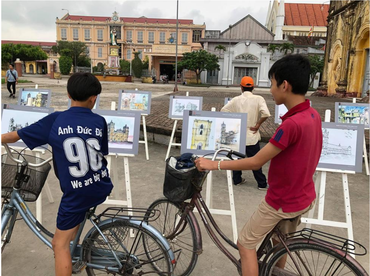
Các em nhỏ ở gần nhà thờ Bùi Chu say sưa ngắm những bức ký họa về ngôi thánh đường của mình ngày 11-5

Những bức họa do một nhóm các kiến trúc sư, sinh viên kiến trúc, những người yêu ký họa, bao gồm cả các em thiếu nhi thuộc nhóm Ký họa đô thị Hà Nội vẽ trong vài đợt viếng thăm nhà thờ Chính tòa Bùi Chu trong hơn 1 năm qua, kể từ khi có tin ngôi thánh đường với tuổi đời hơn trăm năm này sắp bị hạ giải.