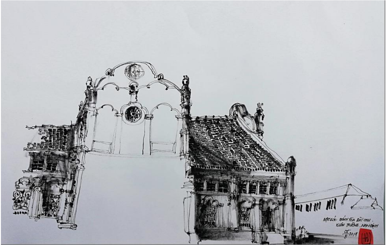
Mái ngói thâm nâu và tường rêu in bóng thời gian lên ngôi thánh đường có tuổi đời 134 năm, tranh của KTS Nguyễn Hoàng Lâm