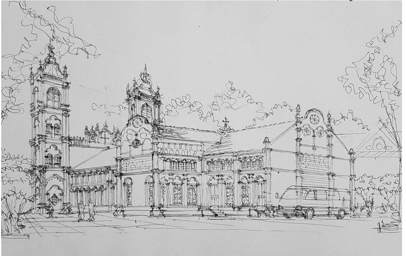
Nhà thờ Bùi Chu đẹp mộng mị trong ký họa của Nguyễn Trung Dũng