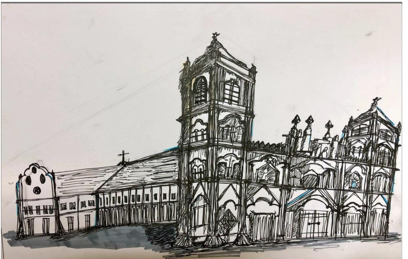
Nhà thờ Bùi Chu trong nét vẽ 'già dặn' hơn của bé An Duy