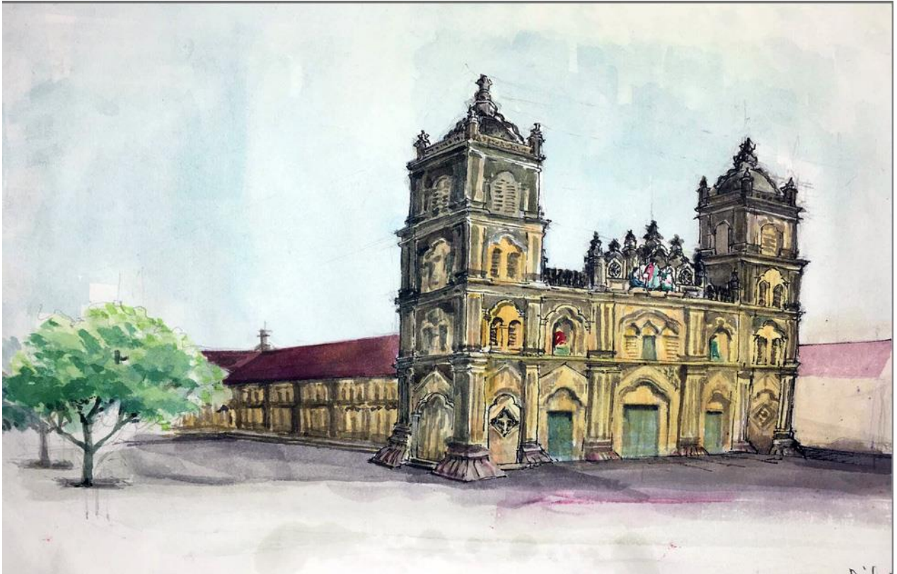
Nhà thờ Bùi Chu qua con mắt của Trần Kim Oanh

Những bức ký họa đầy cảm xúc từ những người yêu di sản này đã mang đến cho người xem nhiều bất ngờ, níu đôi mắt chúng ta vào những đẹp đẽ của công trình kiến trúc nhà thờ cổ này mà bình thường nhiều người đã không để ý tới.