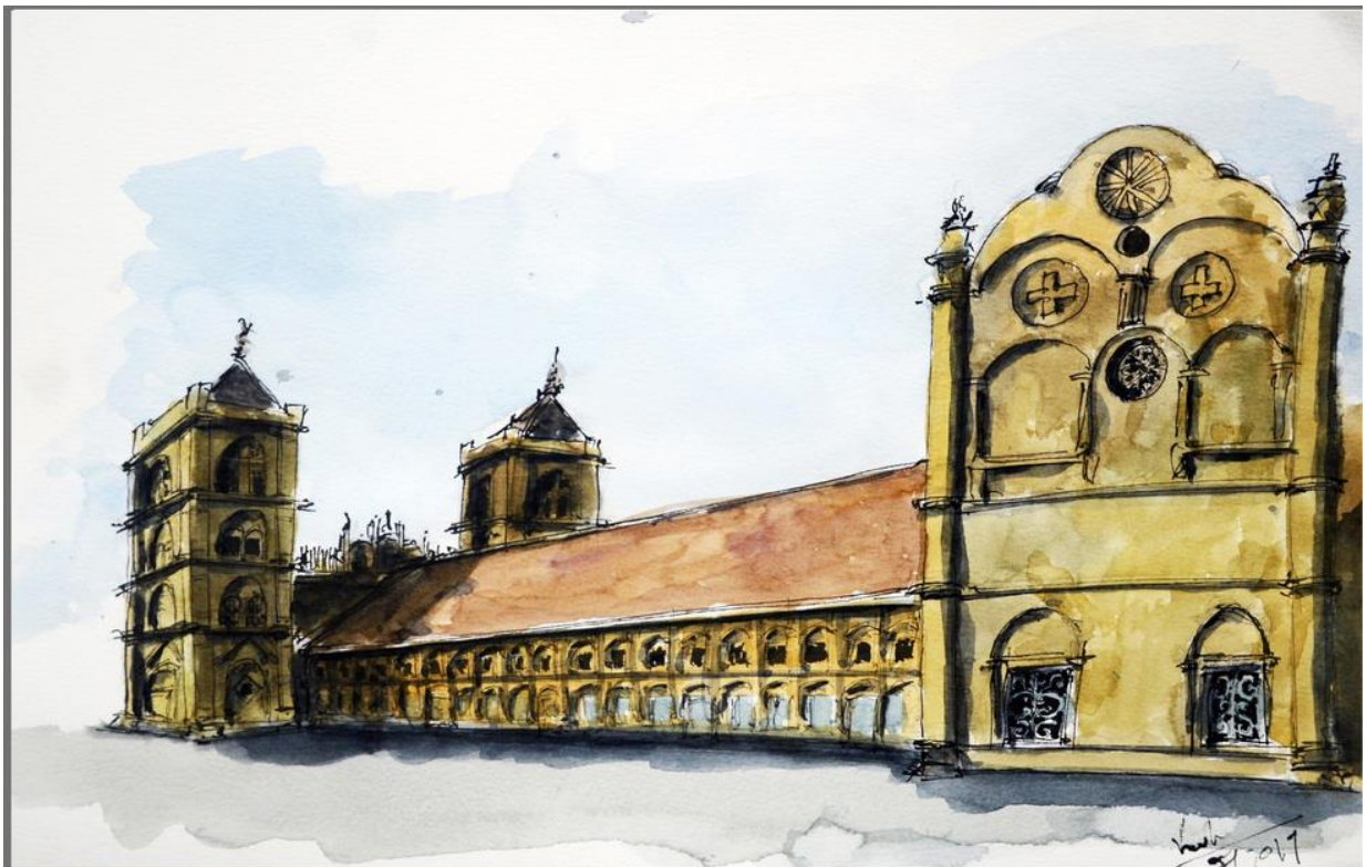
Chính tòa Bùi Chu dưới nét vẽ của Vương Hoàng Long