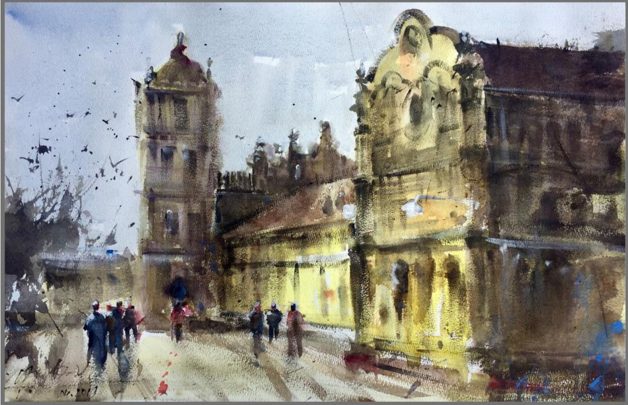
Nhà thờ Bùi Chu nhuộm màu thời gian trong ký họa của Chu Quốc Bình

Cùng ngắm vẻ lộng lẫy bất ngờ của nhà thờ Bùi Chu qua các bức ký họa: