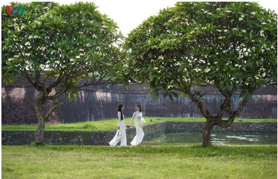
Huế êm đềm với những công viên xanh màu hai bên bờ sông Hương, màu phượng đỏ thắm của mùa hè hay màu hoa điệp vàng khoe sắc trước cổng trường Quốc Học, trường Hai Bà Trưng.