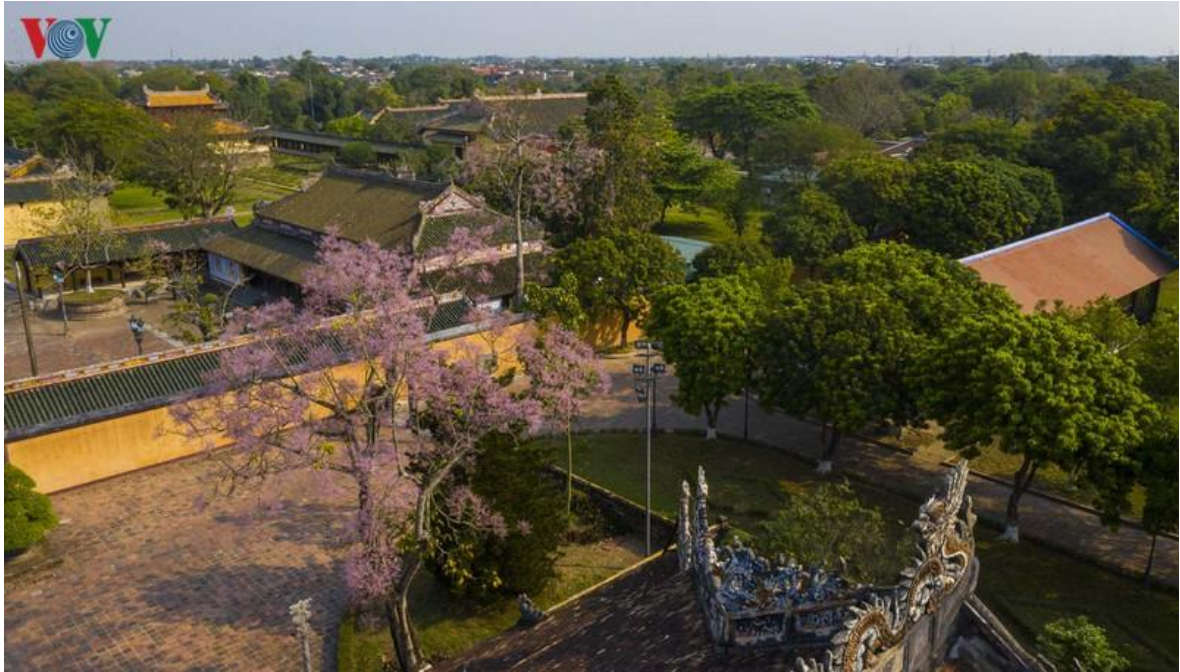
Huế khoe sắc dưới ánh nắng đầu hạ, con đường dường như mềm mại hơn, đầy màu sắc.