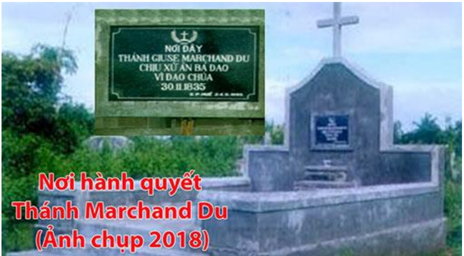
Nơi hành quyết Thánh Marchand Du (Ảnh chụp 2018)

Tác giả nói đến cái chết cảm động của Phaolô Tông Viêt Bường , người con của làng Phước Quả, Giáo xứ Chính Tòa Phủ Cam, bị