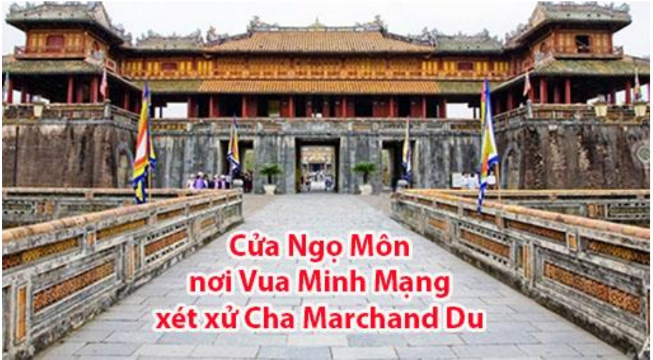
Cửa Ngọ Môn nơi Vua Minh Mạng xét xử Cha Marchand Du